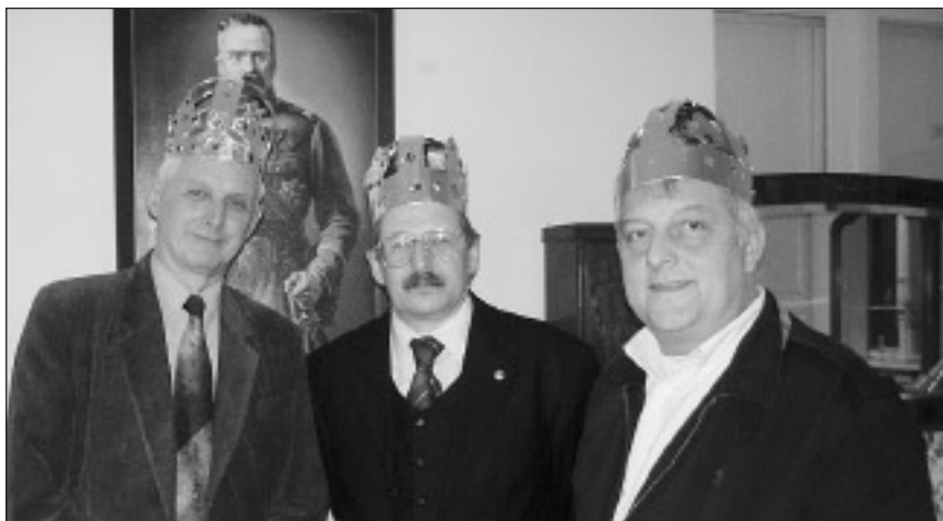
Kolędowi Trzej Królowie

Wypada zatem powiedzieć na zakończenie – do zobaczenia na kolejnym Spotkaniu z Pieśnią w dniu 3 maja 2012 roku na boisku szkolnym. Info:KS