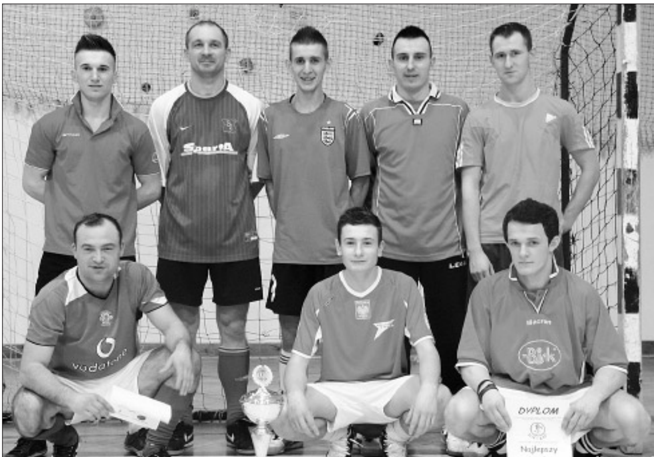
Zwycięzca drużyna turnieju w kategorii Open: „Zbieranina” z Prażmowa . Ł.K.